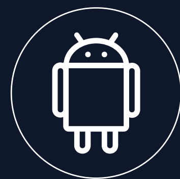
Android 12(GMS) 操作系统