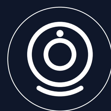
前置 5.0MP 后置 13.0MP