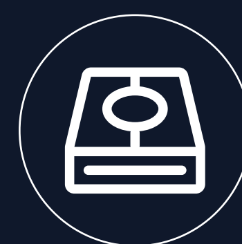
支持扩展固态硬盘