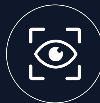
700cd/m 2 显示