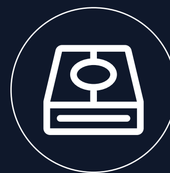
支持扩展固态硬盘